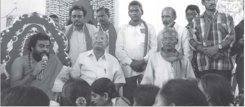
మతం మారిన మన సోదరులను 53 మందిని తిరిగి హిందూ ధర్మంలోకి ఆహ్వానిస్తున్న పూజ్యశ్రీ శివస్వామి, శైవక్షేత్ర పీఠాధిపతులు.