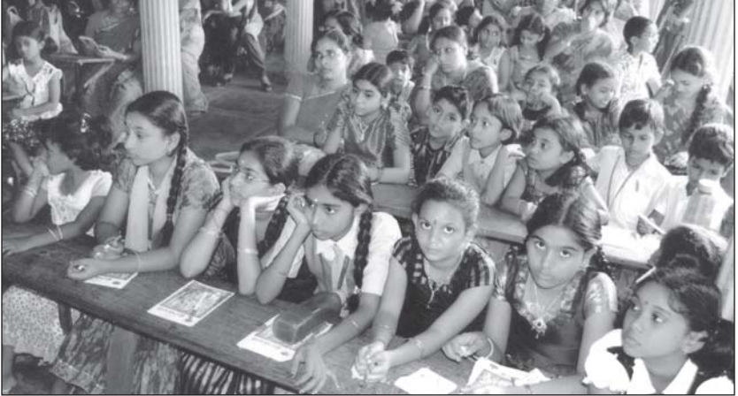
తేది- 27-11-2011న ఒంగోలులో జరిగిన భగవద్గీత కంఠస్థ పోటీలలో విజేతలైన విద్యార్థులకు బహుమతి ప్రధానం చేస్తున్న దృశ్యం. - గీతా కంఠస్థ పోటీలలో పాల్గొన్న విద్యార్థిని - విద్యార్థులు.