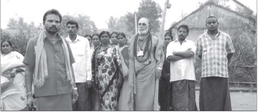
పేరంపేటలో పాదయాత్ర చేస్తున్న పూజ్య స్వామీజీలు

పశ్చిమ గోదావరిజిల్లా, జంగారెడ్డిగూడెం ప్రఖండ, పేరంపేట గ్రామంలో, తేది. 4-1-2012న జరిగిన పునరాగమన కార్యక్రమాల దృశ్యాలు.