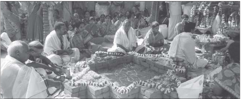
పునరాగమనం సందర్భంగా యజ్ఞం, పూజ నిర్వహిస్తున్న దృశ్యం.