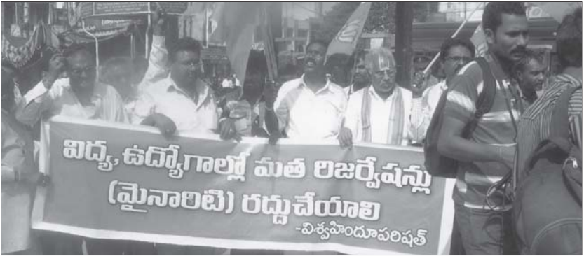
తేది. 29-12-2011న - ఓబిసి రిజర్వేషన్ 27 శాతం నుండి - చీల్చి 4.5 శాతం రిజర్వేషన్లను ముస్లింలకు ప్రభుత్వం ఇస్తున్నందున - నెల్లూరులో మత రిజర్వేషన్లను రద్దుచేయాలని ధర్నా నిర్వహిస్తున్న దృశ్యం.